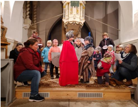
In der Kirche beim Martinsspiel