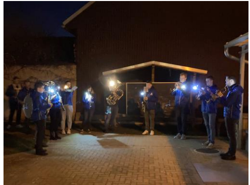
Die Bläser im Kindergarten